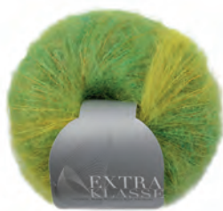
Extraklasse multicolor Farbe 4453