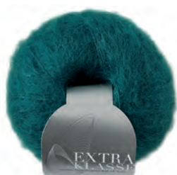
Extraklasse Farbe 4507