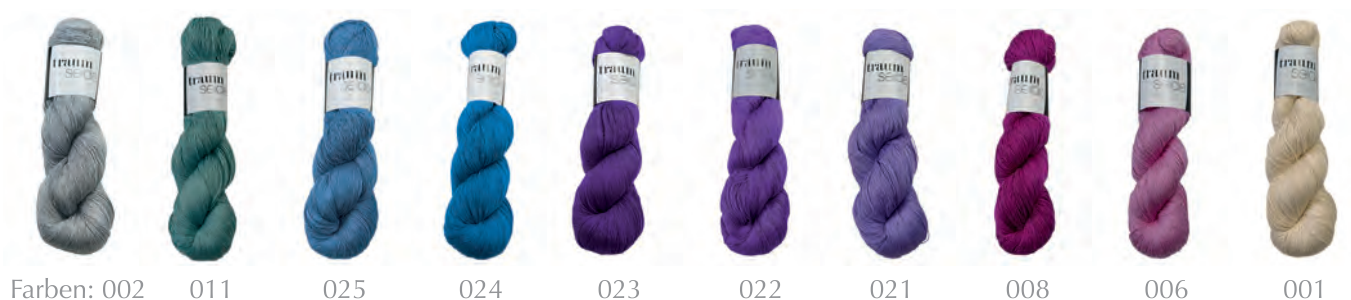
Farben: 002 011 025 024 023 022 021 008 006 001