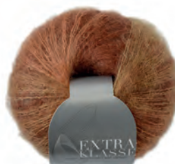
Extraklasse multicolor Farbe 4452