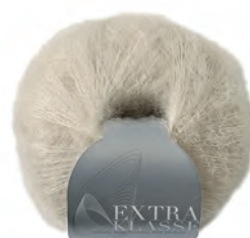
Extraklasse Farbe 4511

Die Anleitungen und Garne zu den dargestellten Lacetüchern erhalten Sie im Wollfachhandel.