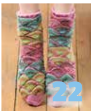
Segment für Segment