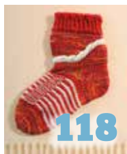
Für kleine Jungs